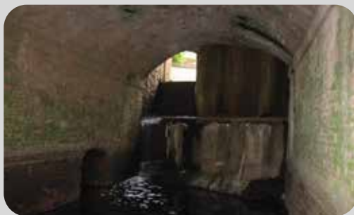
IMPIANTO DI BONIFICA MANCASALE